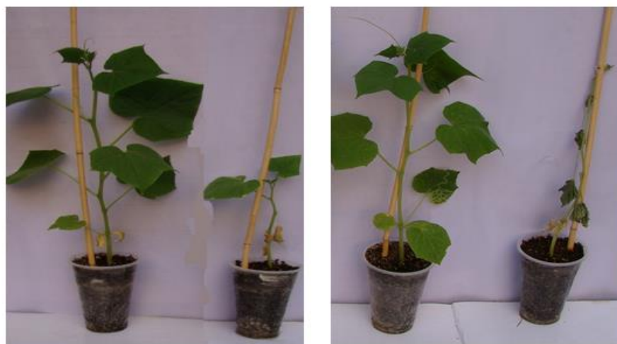
شکل ۳. نتایج آزمون بیماریزایی جدایه قارچ بیمارگر بعد از ۳۰ روز تلقیح بوته‌ها. گلدان سمت راست هر تصویر، تیمار قارچ بیمارگر و گلدان‌های سمت چپ هر تصویر، تیمار شاهد است.

علایم بیماری جدایه قارچ بیمارگر بعد از ۳۰ روز از تلقیح مایه بیمارگر ظاهر گردید. علایم بیماری به صورت پژمردگی، کوتولگی بوته های بیمار، زردی، نکروز شدن طوقه و ریشه و آوندهای گیاه ظاهر گردید. در تیمار شاهد بوته‌ها کاملاً سالم بودند. شدت بیماریزایی جدایه قارچ بیمارگر با میانگین بیماری زایی ۷۵ درصد تعیین گردید (شکل ۳).