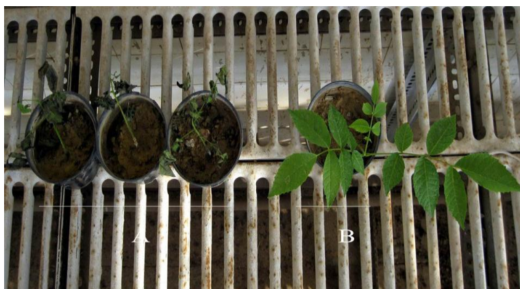
شکل ۴. علائم بیماری توسط قارچ Phytophthora citricola روی دانه‌های گردو (A) در مقایسه با شاهد (B) بعد از گذشت هشت روز