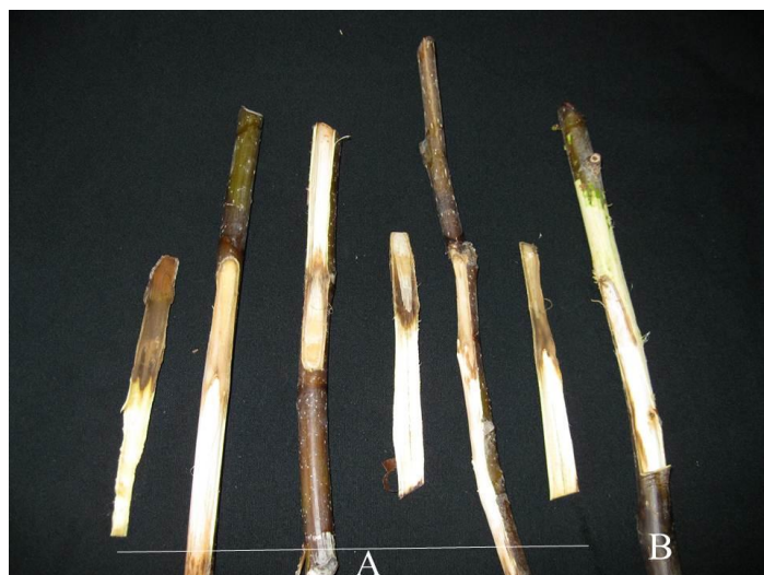
شکل ۳. علائم بیماری حاصل از مایه‌زنی Pythium sp. روی شاخه‌های بریده‌گردو (A) در مقایسه با شاهد (B)