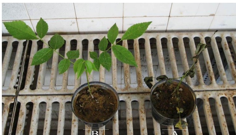
شکل ۵. علائم بیماری توسط Pythium sp. روی دانه‌های گردو (A) در مقایسه با شاهد (B) بعد از گذشت دو هفته

می‌شوند. مشخصات جدایه‌های پیتیموم با مشخصات منابع معتبر مطابقت نداشت و احتمالاً یک گونه جدید از این قارچ باشد و لازم است مطالعات بیشتر و دقیق‌تری روی آن انجام گیرد. اگرچه برخی خصوصیات این جدایه‌ها نظیر