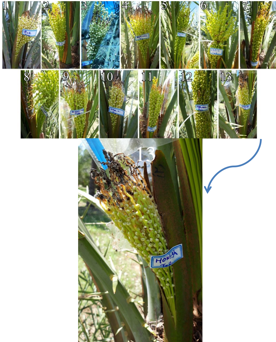
شکل ۲. علائم و آثار ۱۳ جدایه قارچ Mauginiella scaettae روی رقم نخل استعمران. اعداد ۱-۱۳ نشان داده شده در شکل نمایانگر جدایه‌های قارچ Mauginiella scaettae به کار رفته جهت ارزیابی آزمون شدت بیماری می‌باشد. ۱- F a-za ، ۲- Ilam-sa ، ۳- Abad-sa1 ، ۴- Behb-ma1 ، ۵- Haji-ma1 ، ۶- Kheshbid-za ، ۷- Shab-ka4 ، ۸- Karb-ma ، ۹- Kuwa-ma1 ، ۱۰- Gena-ma ، ۱۱- Mehr-sa ، ۱۲- Ahva-ma1 ، ۱۳- Hove-gh

احتمال پنج درصد اختلاف معنی‌داری دارند (جدول ۵). و این امر بیانگر این است که مناطق نمونه‌برداری که شامل پنج استان ایران و دو کشور همجوار خارجی (عراق و کویت) بودند از نظر درصد شدت بیماری در گروه‌های مختلف قرار می‌گیرند به طوری که نمونه‌های